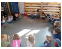
Der Kindergarten "Namen Jesu" beteiligt sich am Projekt "Singende Kindergärten". Gemeinsames Singen soll damit wieder stärker in den Kindergartenalltag eingebunden werden.

Die eigene Stimme zum Klingen bringen und Rhythmusgefühl entdecken, dazu haben die Kleinen aus dem Kindergarten „Namen Jesu“ in den nächsten Wochen die Gelegenheit. Als eine von 375 deutschlandweiten Einrichtungen beteiligt sich der Kindergarten am Projekt „Singende Kindergärten“, das von dm-drogerie markt ins Leben gerufen wurde.